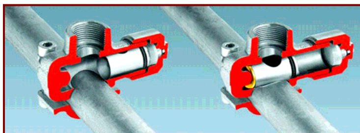
Framco T-Plus vor Zündung der Treibladung