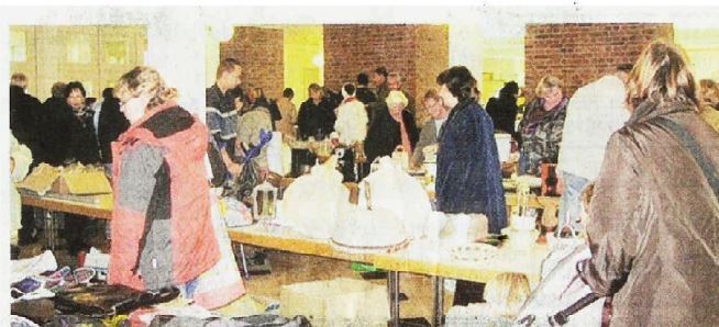
Einen Tauschtag hat „Nimm & Gib“ im vergangenen Jahr in der Memminger Stadthalle veranstaltet.