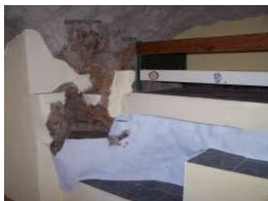
2. Wohn-Höhle innen