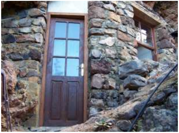
Eingang + Fenster 2. Wohn-Höhle