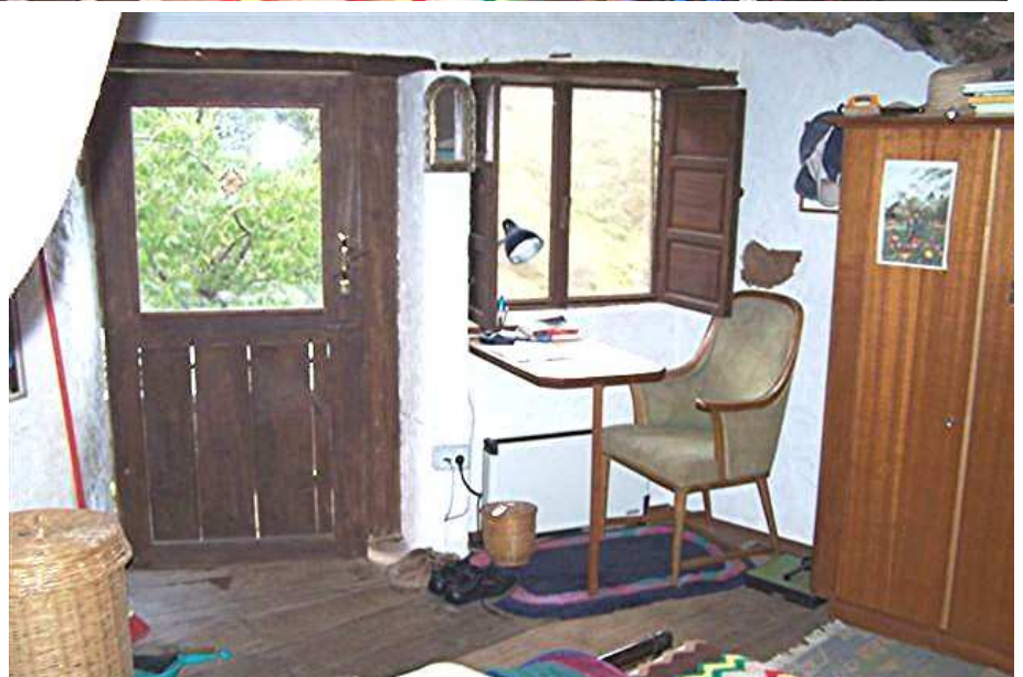
Schlafraum Fenster > mit Schreib-Platz