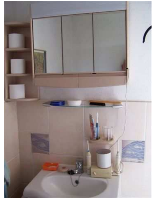
2 x Sanitär