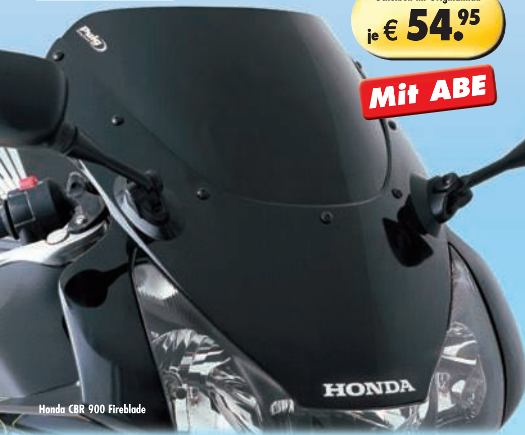
Honda CBR 900 Fireblade