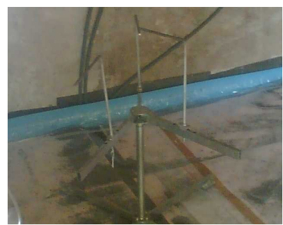
Haspel zum Abrollen des Rohres