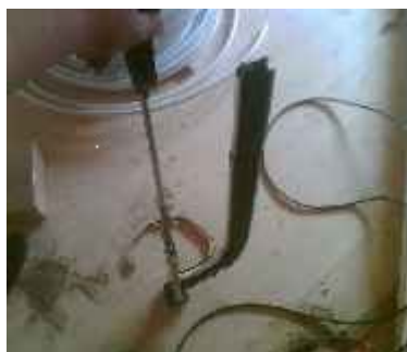
Tacker mit klemmen drin zum befestigen des Rohres